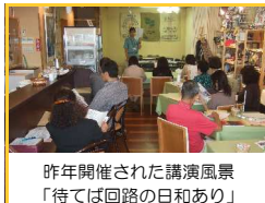
昨年開催された講演風景 「待てば回路の日和あり」