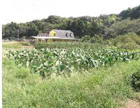
氷取沢市民の森 横浜市磯子区 田園風景を堪能したあとは、心地よい上りの山道となる

京急金沢文庫駅からバスに乗り、氷取沢バス停で下車し、氷取沢神社から氷取沢市民の森のルートがはじまります。大岡川の上流に向けて、川沿いに歩いていくと、あたり一面に畑が広がり、山のふもとには、牧場が見えてきます。ここが横浜とは思えないのどかな風景を堪能することができます。牧場を過ぎて、山道に入り、おおやと広場を経由して、ゴールのいっしんどう広場まで、スタートから90分ぐらいかかります。