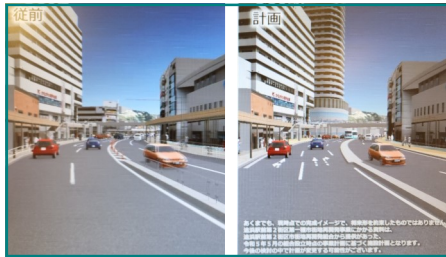
国道16号下り車線からの追浜駅前の眺め

この映像は、横須賀市が神奈川県自治基盤総合補助金を活用しながら、沿道の景観や建築物の規模などを3D化することで今後のまちづくりに活かせるように制作されました。