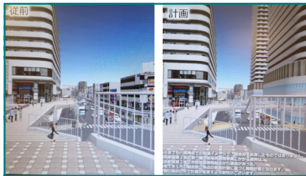
立体歩行者道路からの追浜駅前の眺め

追浜駅前将来型のシミュレーション動画がサンビーチ追浜の4階にある追浜えき・まち・みちデザインセンターで公開されています。画面が2分割され、現在の追浜を3D化した「従前」と将来の追浜を3D化した「計画」の映像が、歩行者やドライバーの目線で比較しやすいように表現されています。