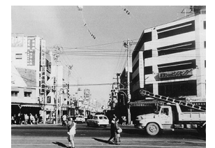
昭和43年頃の追浜銀座通り

【協力】 関東学院大学 建築・環境学部黒田研究室 【展示解説】 申込不要・無料 いずれも13:30～14:30 2024年12月3日(火) 2025年1月25日(土) 2025年3月23日(日)